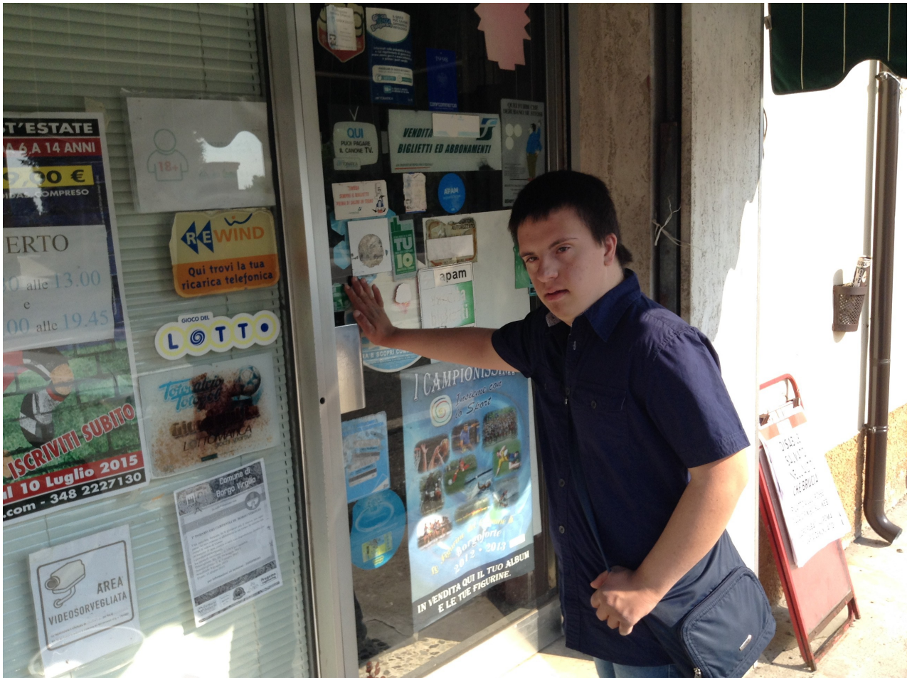
ENTRO IN TABACCHERIA