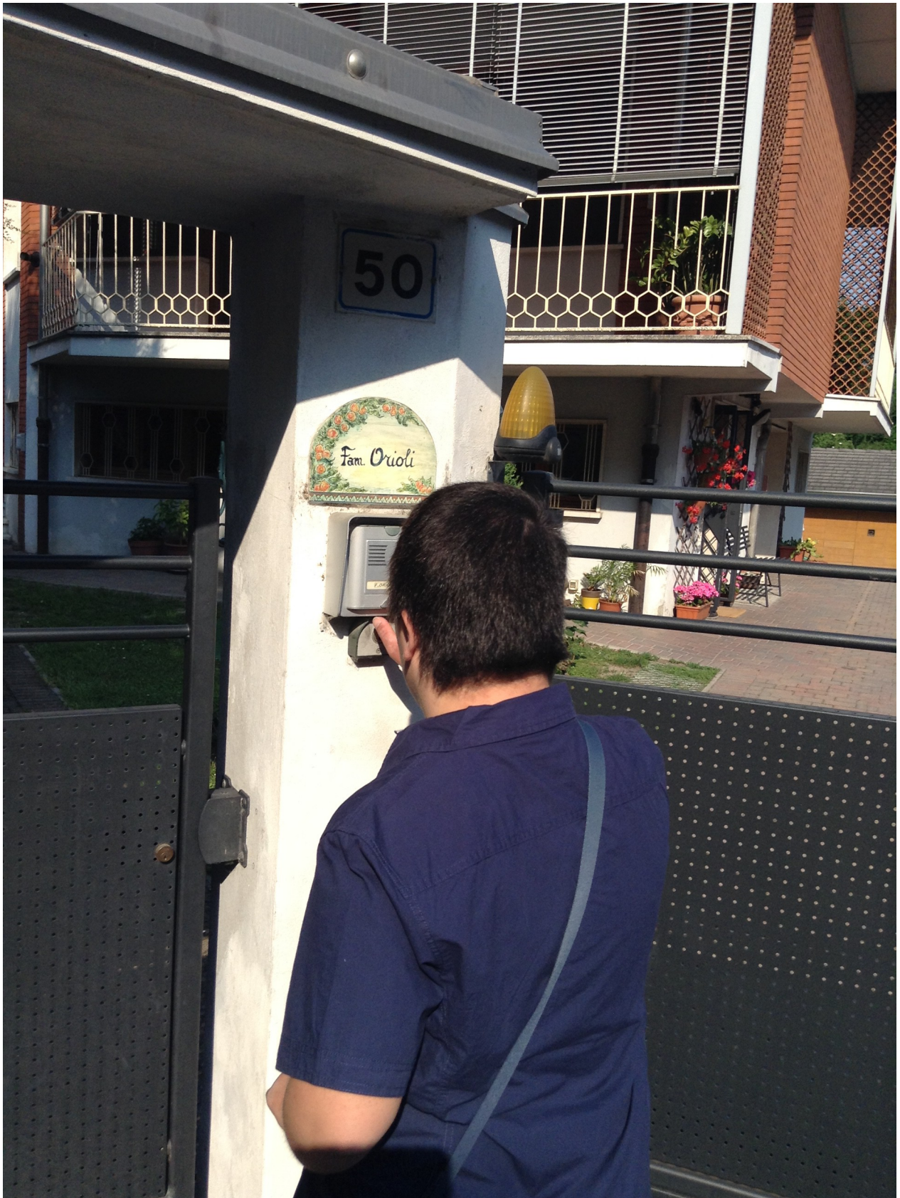
SUONO IL CAMPANELLO