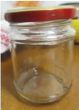
5 (CINQUE) VASETTI CON COPERCHIO