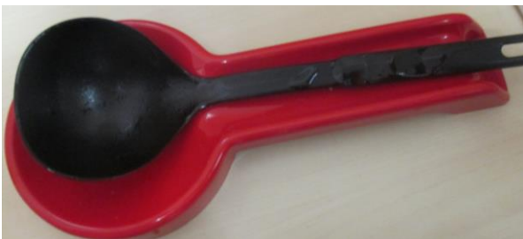
1 (UNO) MESTOLO